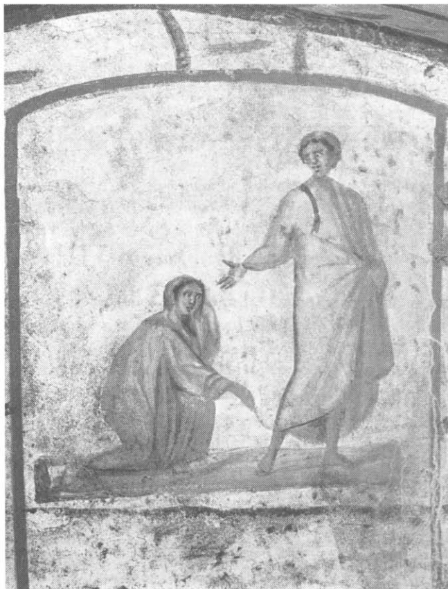
Фреска из катакомб св. Петра и св. Маркеллина, нач. IV в.

Сцена беседы Иисуса с женщиной, страдавшей кровотечением. Эта женщина, мучившаяся на протяжении многих лет, исцелилась, прикоснувшись к одежде Иисуса, «силой, которая вышла из Него» (ср. Мк 5, 25–34).