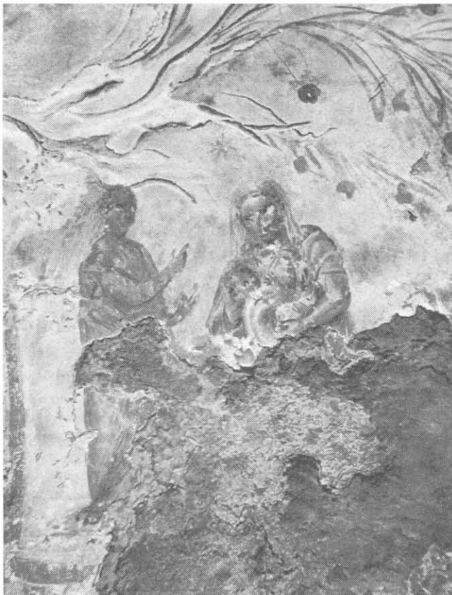
Фрагмент фрески из катакомб Прискиллы в Риме, нач. III в. Самое древнее изображение Пресвятой Девы Марии.

Тема этого изображения, одного из самых древних в христианском искусстве, представляет сердцевину христианской веры — тайну Воплощения Сына Божия, рожденного от Девы Марии.