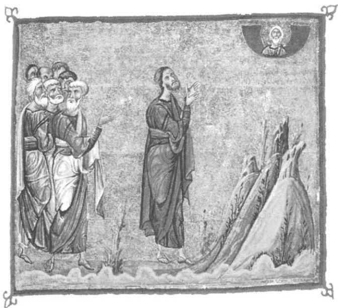
Миниатюра из монастыря Дионисиу на горе Афон (кодекс 587), выполненная в Константинополе в 1059 г.

Христос обращается к молитве к Отцу (ср. № 2599). Он молится в уединении в пустынном месте. Его ученики наблюдают за Ним, почтительно оставаясь на расстоянии. Св. Петр, глава апостолов, обращается к другим ученикам Христа, указывая им на Того, Кто есть Учитель и Путь христианской молитвы (ср. № 2607): «Господи! научи нас молиться» (Лк 11, 1).