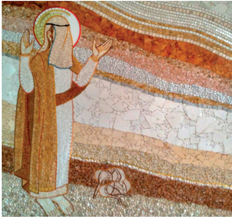
«Моисей», мозаика М. Рупник

Опыт сорока лет скитаний в пустыне, должен был сделать избранный народ новыми людьми. То же самое и с нами может сделать время Великого поста, и сделает, если только мы откроемся на действия Бога. Ставка очень высока – наше спасение.