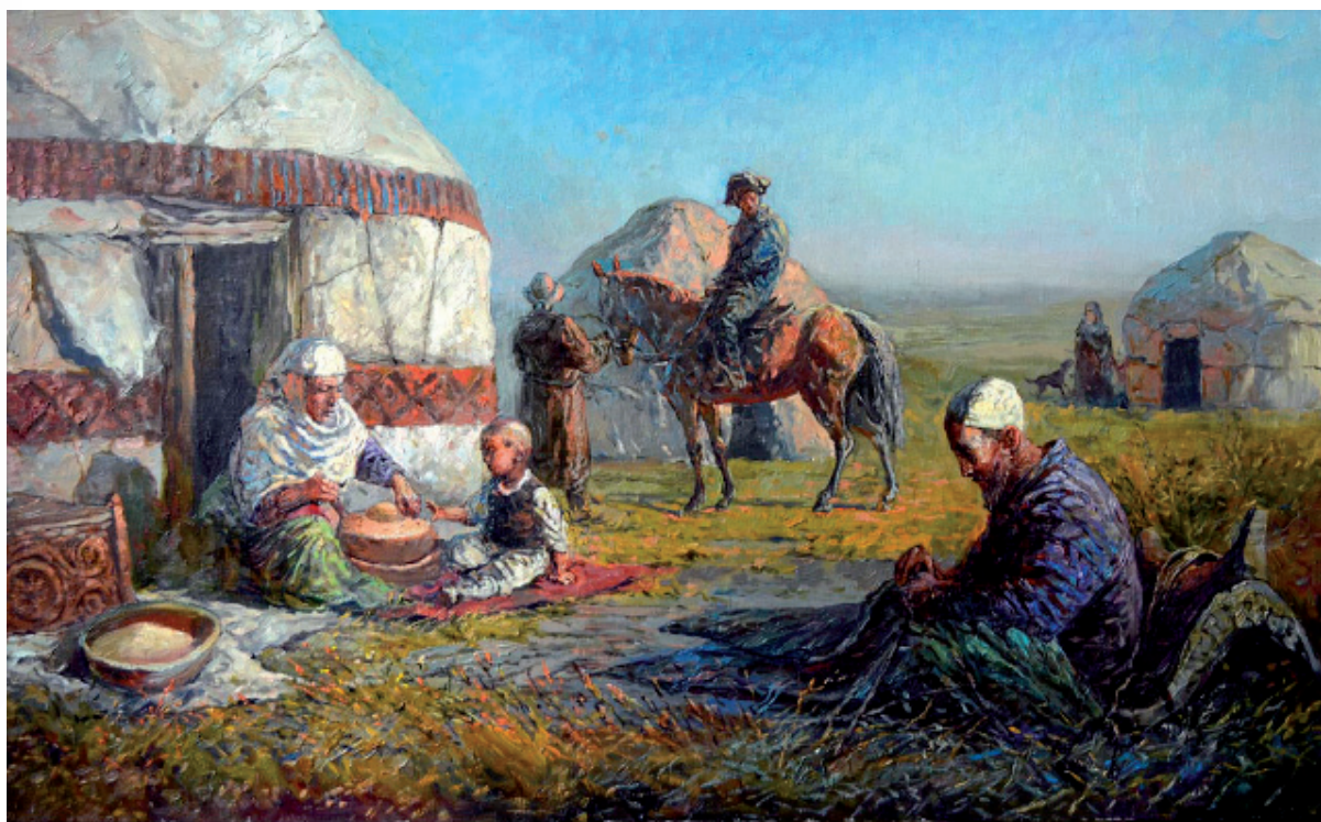
Будни в ауле, Евгений Ким (современная живопись)

Наиболее сложные отношения у казахского народа с белым и черным цветами. Большое место в материальной и духовной культуре занимают черный и белый цвета. Именно они занимают противоположенную позицию: белое – черное; плохое – хорошее; высокое – низкое и т.д. Остальные цвета спектра таких оппозиций не образуют.