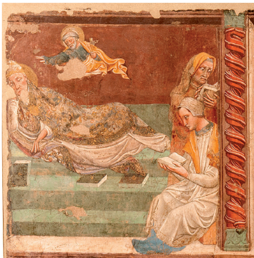
Сон св. Целестина I

Хотя Целестин был Папой в непростые моменты, когда мир и покой в Церкви нарушали различные ереси и лжеучения (манихеи, донатисты, новациане, пелагиане и др.), а варварские орды начали свое движение вглубь Империи, твердый, но добрый характер Целестина по-