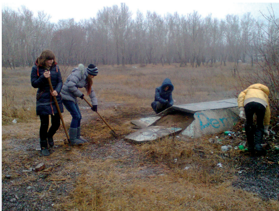
Школьники на субботнике в парке.

Людмила Андреюк Ольга Ясинская Декабрь 2018