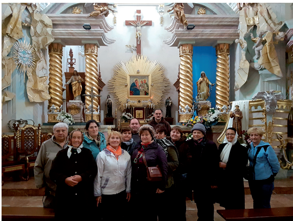
Санктуарий Божьей Матери Скапулярия в Бердичеве

1 сентября 2018 г. В музее собран материал о репрессиях мучеников за веру, который оформлен в виде 15 стояний Крестного пути. Без слез там невозможно находиться.