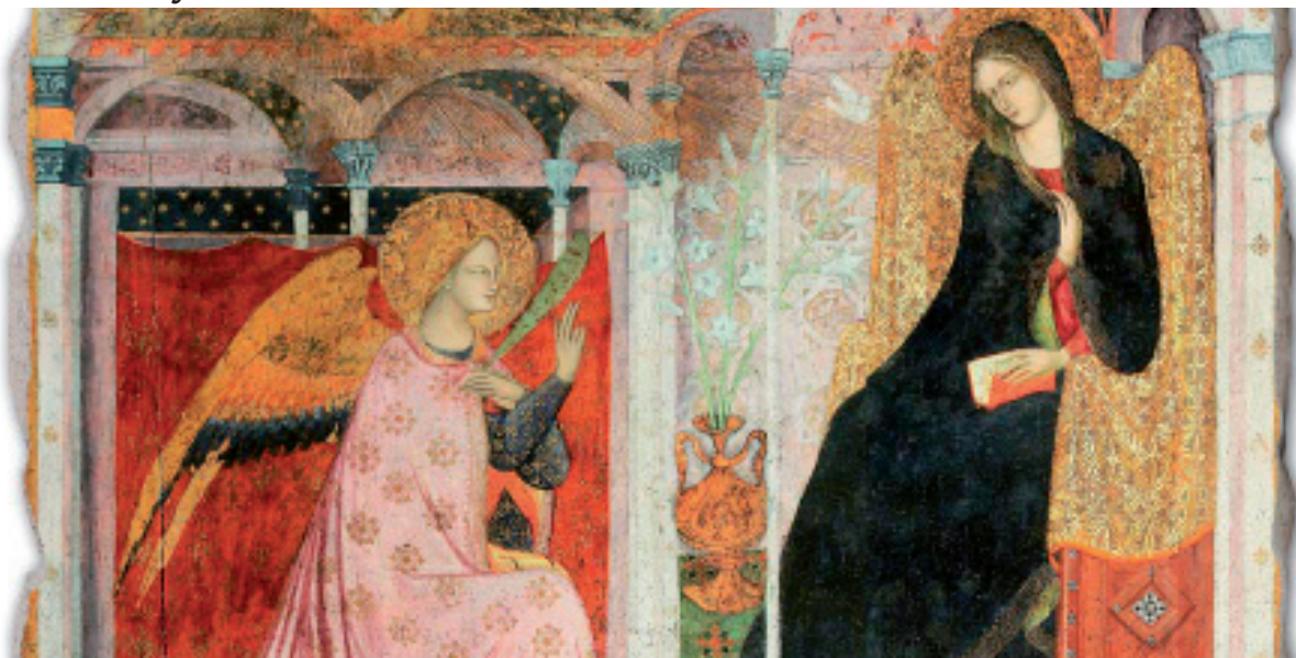
Благовещение (1393), Порциункула, Ассизи