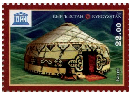
Юрта на почтовой марке Кыргызстана

Большая часть жизни кочевников проходила в его микрокосмосе – юрте. Она была одной из доминант жизнеобеспечения казахов, она же была показателем искусства, здесь каждая вещь, имеющая утилитарное значение, способствовала своими качествами духовности, проявившимися в декоративно-прикладном оформлении.