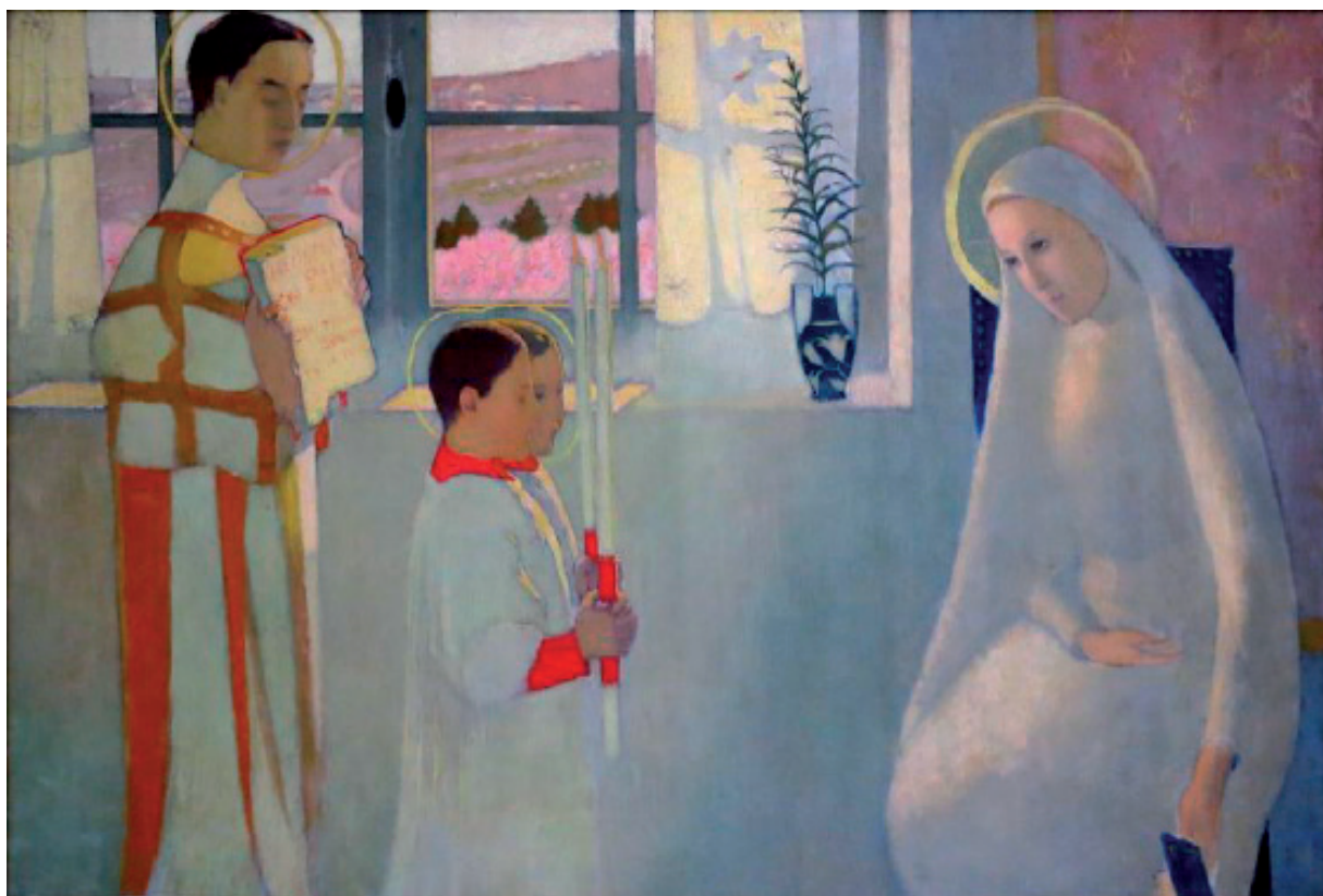
Рис: Морис Денис, Благовещение (Мария и Слово), Франция, 1891

ми нуждами, за всех людей и за спасение всего мира (см. Sacrosanctum Concilium, 53; 1 Тим 2, 1-2). Под руководством священника, который начинает и заканчивает «молитву верных», «народ некоторым образом отвечает на воспринятое в вере слово Божие и, исполняя свое служение священства крещеных, приносит Богу прошение о спасении всех людей» (Общее наставление к римскому Миссалу, 69). После отдельных ходатайств, прочитанных диаконом или лектором, собрание присоединяется к нему молитвой: «Просим Тебя, услышь нас».