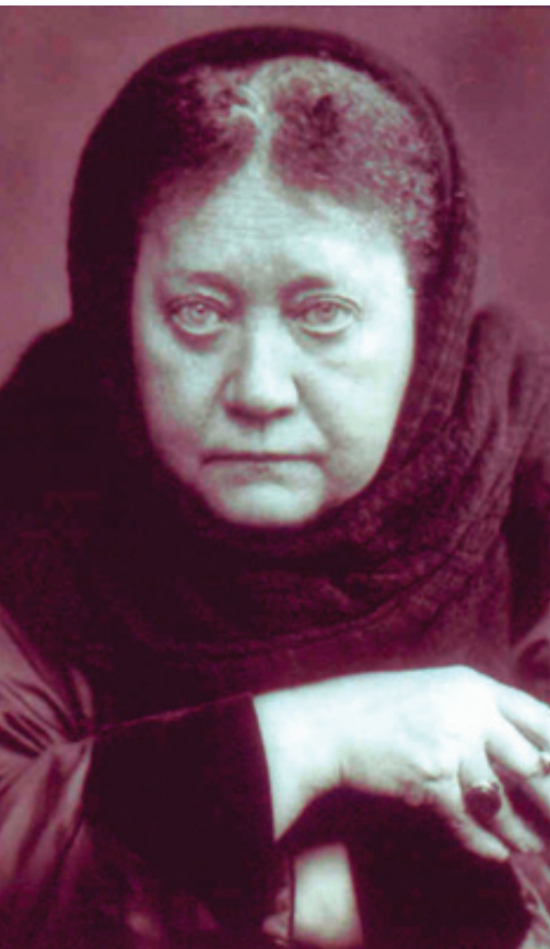
Елена Петровна Блаватская родилась в России в 1831 году, умерла в 1891 году в Англии. Основательница эзотерического учения – Теософия.

Карма – понятие индуистского происхождения, а также излюбленный термин оккультистов, например, Елены Блаватской или Елены Рерих. Ученые