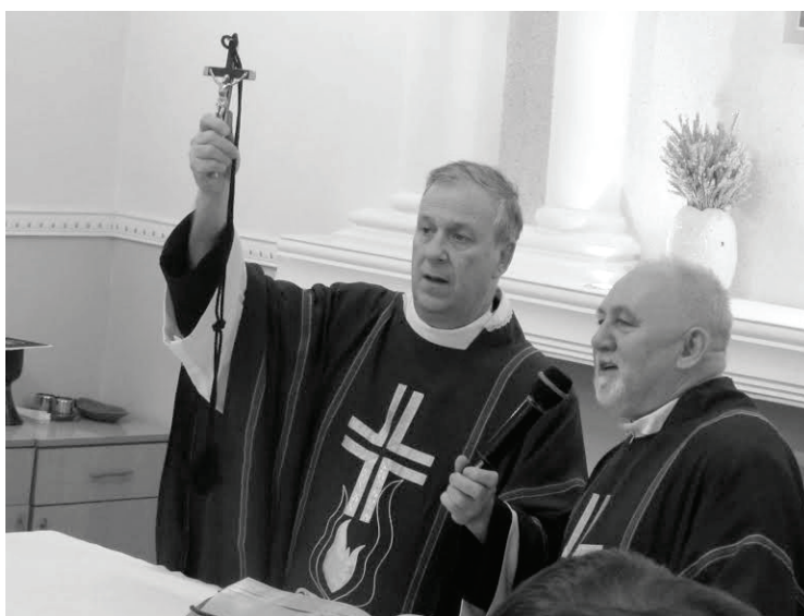
Генеральный настоятель о. Луис Лоуген ОМІ (слева) благословляет церковь в Туркменистане

– Впервые я приехал в Туркменистан вместе с Нунцием из Алматы 4 января 1997 года. В то время я на две недели остановился в Ашхабаде – в Красноводск не поехал. На постоянную миссию в Туркменистан мы вместе с отцом Радославом Змитрови-