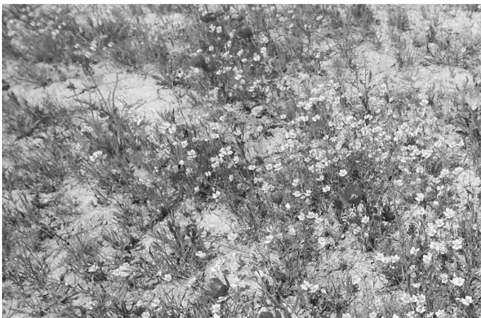
Пустыня Каракумы в цветах...

километрах от Бреста и Тересполья, между Беларусью и Польшей, где протекает река Буг. Там находится святилище Божьей Матери Единства. Я служил паломникам, которые туда приезжали. В конце каждого паломничества мы молились под открытым небом, совершая Крестный путь. От последнего стояния до границы оставалось около 500 метров, и я всегда спрашивал паломников, не хотят ли они взглянуть на реку и на границу. Все соглашались, так как это было уже совсем близко. Мы подходили к реке и с волнением смотрели на противоположный берег. Эта река-граница была барьером для тех, кто хотел нести Благою Вестю находящимся по ее другую сторону. Мы стояли, беседовали, и я вспоминал, что когда-то здесь был мост, и люди приходили к нам в Кодень, особенно на Торжество Успения Пресвятой Богородицы 15 августа. На этой границе мы молились, чтобы Господь послал свидетелей Благой Вести на Восток. Обычно мы читали молитву Господню «Отче Наш» в этой интенции и так завершали наше па-