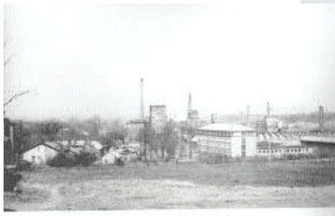
Фабрика соды, место работы Войтылы