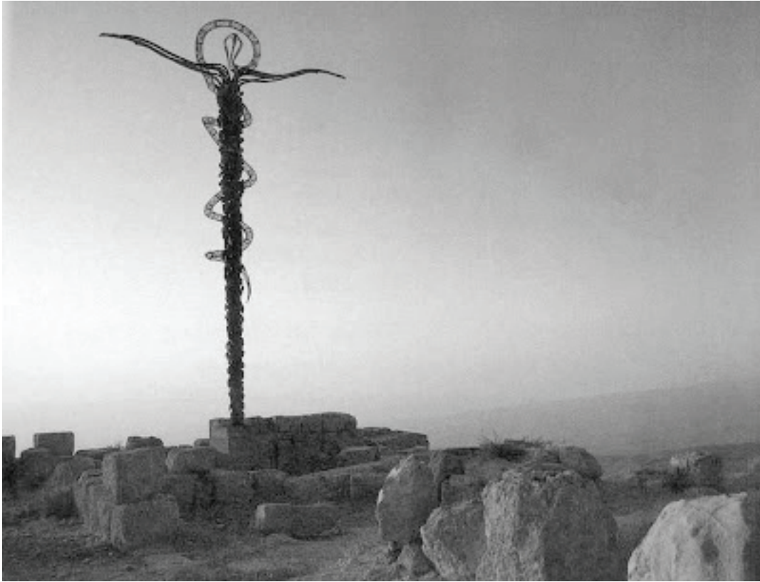
Святая земля: «Жезл Моисея»

ние за ними исключительно материальной ценности, принесло им несчастье и смерть. Таким образом, их смерть стала воплощением «проклятия» за грех идолатрии, который они совершили. Однако еврейская общность была убеждена в том, что именно из-за этого им угрожает еще большее несчастье. Люди, которым было жаль тех солдат, начали искренне молиться за них, потому что считали (а это убеждение было достаточно распространено), что им угрожает потеря вечного спасения. Показательно то, что именно в этом контексте родилось богословие чистилища, как пишет кардинал Й. Ратцингер (Бенедикт XVI), в своем трактате об эсхатологии, переведенном на множество языков (Эсхатология, Познань 2004).