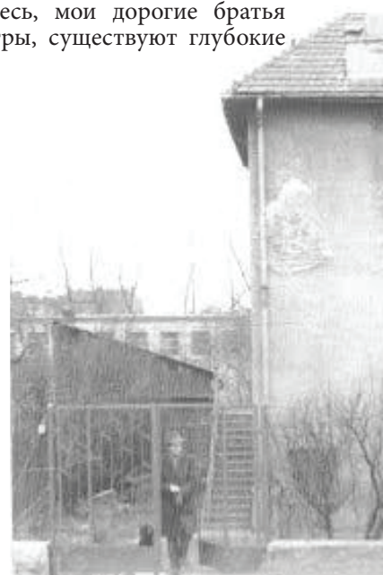
Дом в котором проживал Кароль Войтыла во время оккупации

Здесь, мои дорогие братья и сестры, существуют глубокие