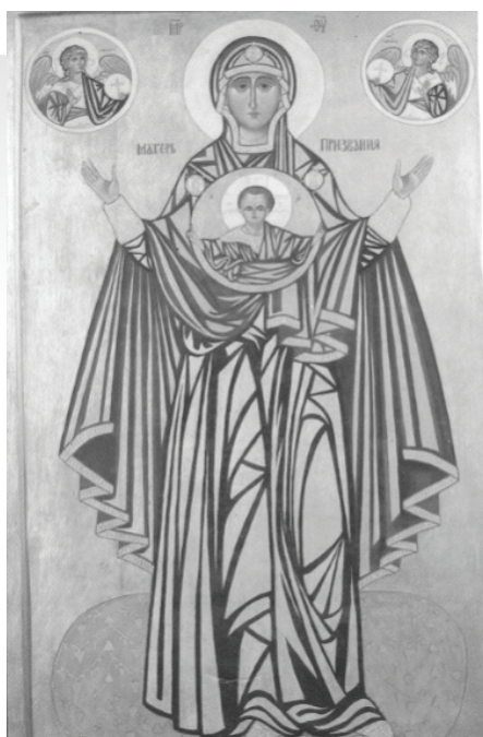
Икона Матери призвания. Святилище Царицы Мира, 151035 Озерное, Казахстан