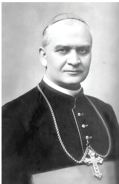
Бл. Георгий Матулевич, основатель Конгрегации служительниц Иисуса в Евхаристии, фотография 1925 г.

Бл. Георгий, восьмой ребенок в семье литовских крестьян, рано потерял обоих родителей и воспитывался у своего дяди. Его путь к священству не был легким – бедность и тяжелая болезнь, от которой он страдал всю жизнь, препятствовали ему в детстве получать систематическое образование. Все же в возрасте 20 лет он смог поступить в духовную семинарию и через 7 лет как один из лучших семинаристов был досрочно рукоположен в священники на послед-