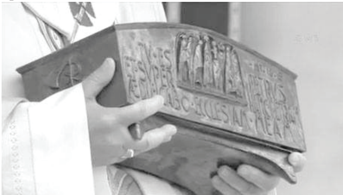
Реликвирий с мощами св. апостола Петра.