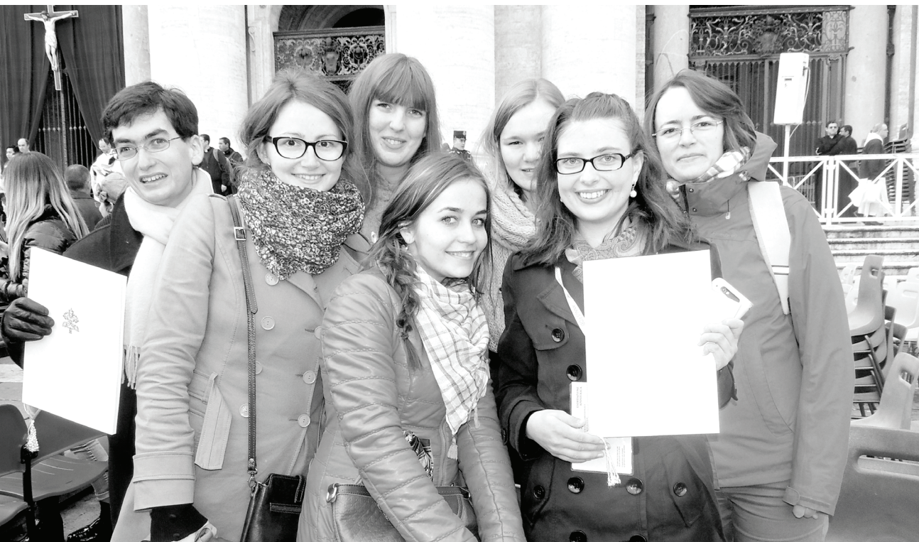
Молодые верующие после получения увещания «Радость Евангелия».

этого он обнял всех восточных патриархов, прибывших в Рим по случаю торжества. Может быть, их вера и есть сокровище Церкви, которое приобретя дорого, нам следует беречь особо усердно?