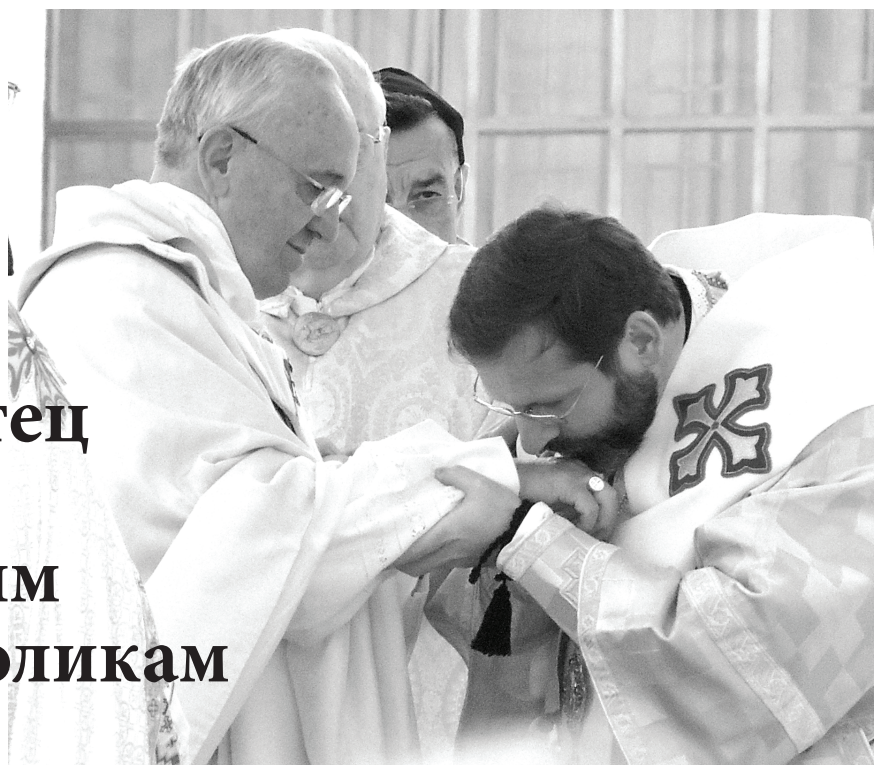
Папа Франциск и архиепископ Святослав Шевчук

Святой Отец Франциск украинским греко-католикам по случаю 50-летия помещения мощей св. Иосафата в ватиканской базилике