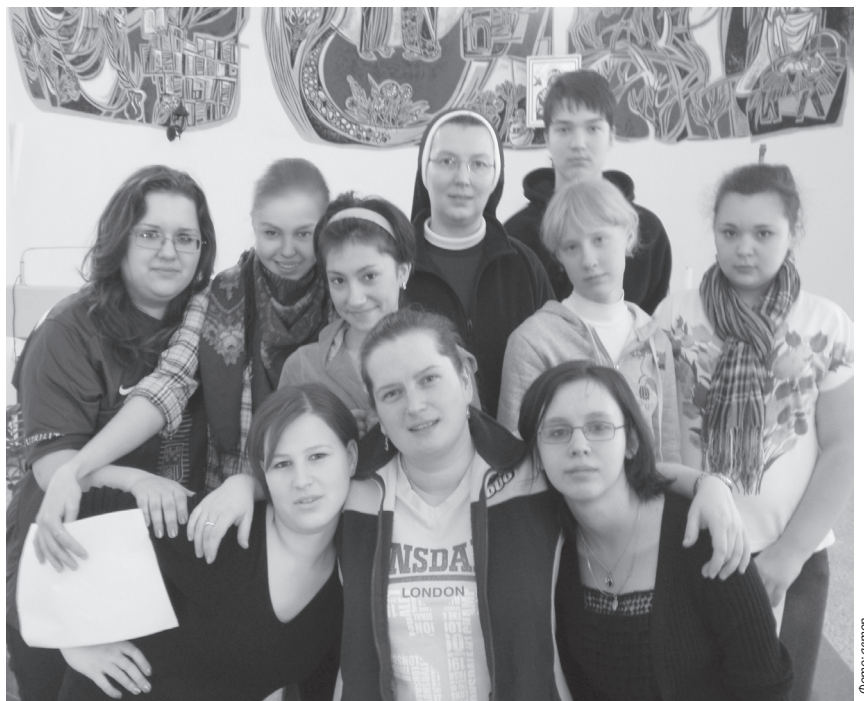
В завершение встречи.

Пятница стала заключительным днем «каникул», последняя лекция была представлена в виде слайдшоу о будущем блаженном