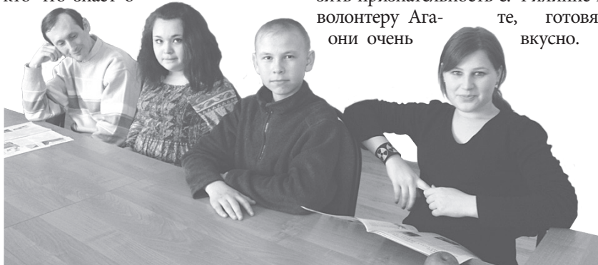
На одной из конференций.

Начало духовных упражнений 23 марта ознаменовалось встречей, знакомством и викториной, на которой мы попытались выяснить, кто что знает о