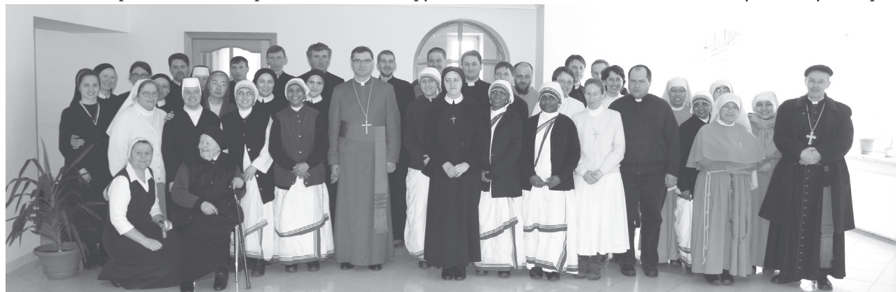
Вместе с духовенством.