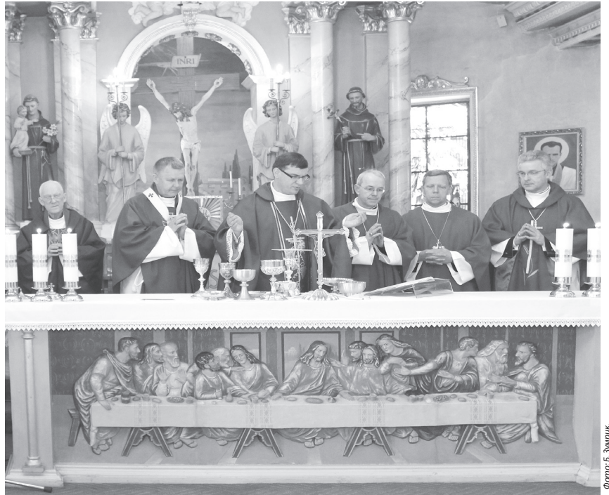
В сослужении с братьями-епископами.

Караганда – это также место, где располагается высшая духовная семинария Марии – Матери Церкви. Семинария – это сердце не только нашей епархии, но Церкви всего Казахстана и Средней Азии. Об этом говорил нам Папа Иоанн Павел II: «Для того, чтобы довести до завершения миссию, которую Он (Бог) вам вверяет, заботьтесь о подготовке кандидатов ко священству и к монашеской жизни. Посвящайте себя с любовью священникам, вашим главным сотрудникам, помогая и руководя ими с отеческим сердцем». Думая о нашей семинарии, я прихожу к мысли о том, что здесь будет необходимо сотрудничество всех священников, монашествующих и епископов в Казахстане и за его пределами, в России и Европе, с тем, чтобы для развития всех призваний к священству и монашеству в семи-