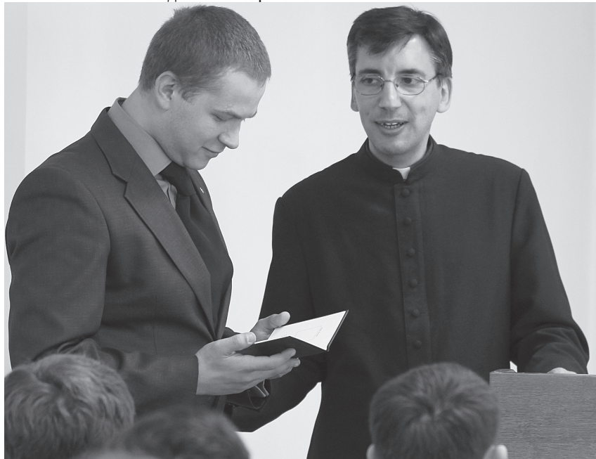
Открытие учебного года в семинарии.

Лично я всегда стремился к тому, чтобы отношения между воспитателями и семинаристами были именно семейными, дружескими отношениями, как у апостолов с Иисусом. Вот образец для семинарии: община апостолов и Иисуса. Апостолы тоже порой ссорились друг с другом, порой не понимали Иисуса, не совсем доверяли Ему. И семинаристы (по себе знаю это) иногда стесняются открыть свою душу воспитателям, им тоже иногда кажется, что от них требуют слишком много. Поэтому нужно время, нужен процесс: мы любим Его, но лишь постепенно понимаем, чего Он хочет, почему он требует так много. Нужно быть с Иисусом, и Он разъяснит тебе притчу. А если ты далеко от Него, то не слышишь Его голос, не понимаешь притчу и не можешь спросить. Тебя не будет среди тех, кому Иисус моет ноги, чтобы ты