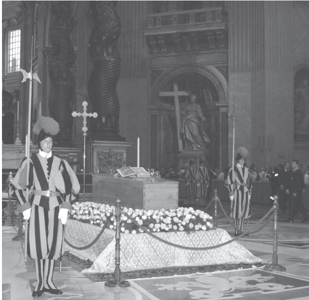
Гроб бл. Папы выставлен для почитания.