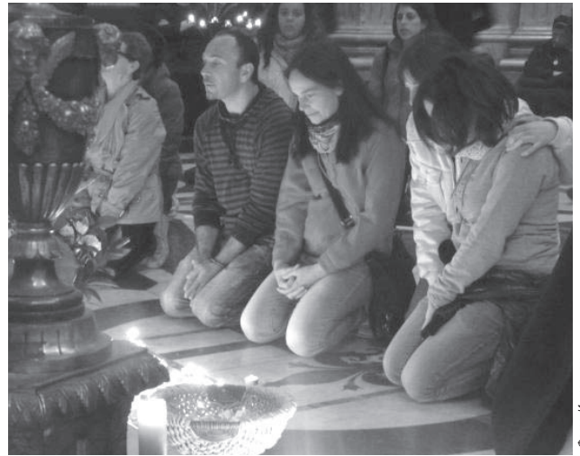
Молитва возле гроба.

► Не могу передать словами те эмоции, которые пробудила во церемония беатификации. Мое сердце