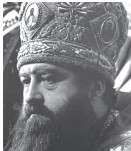
Митрополит Никодим (1929–1978)