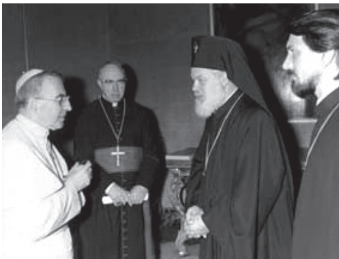
Иоанн Павел I с митрополитом Никодимом и кардиналом Виллебрандсом.

– Да причем здесь вилла Абамелек! Все это фантазии! Здоровье Никодима было серьезно подорвано, и давно.