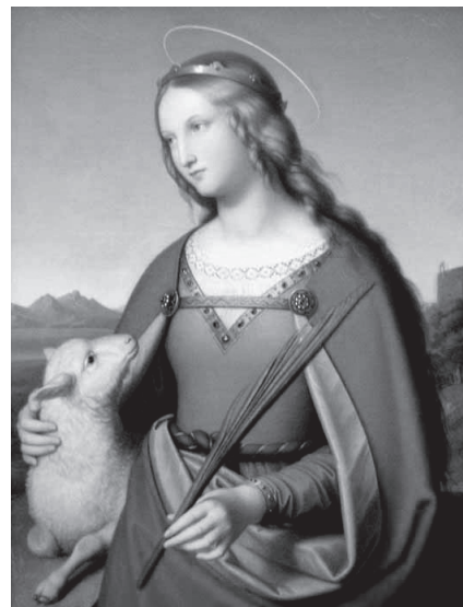
Св. Агния. Иоганн фон Шраудольф, 1842 г., Мюнхен.

Св. Амвросий и св. Дамас воспевают совершенный ею подвиг и ставили Агнию в пример своим современникам, а ее имя было внесено в канон св. Мессы. В «Римском мартирологе» приведены слова св. Иереней, который пишет о ней: «В писаниях и на языках всех народов, а особенно по Церквам восхваляется жизнь св. Агнии, победившей век и тирана и мученичеством освятившей славу чистоты». Дочь Константина Великого принцесса Константина воздвигла в честь св. Агнии храм на via Nomentana , в котором ежегодно 21 января благословляются две специально выращенные монахинями овечки и преподносятся затем в дар Папе. Именно из шерсти этих овечек сотканы белые столы патриархов и митрополитов Католической Церкви.