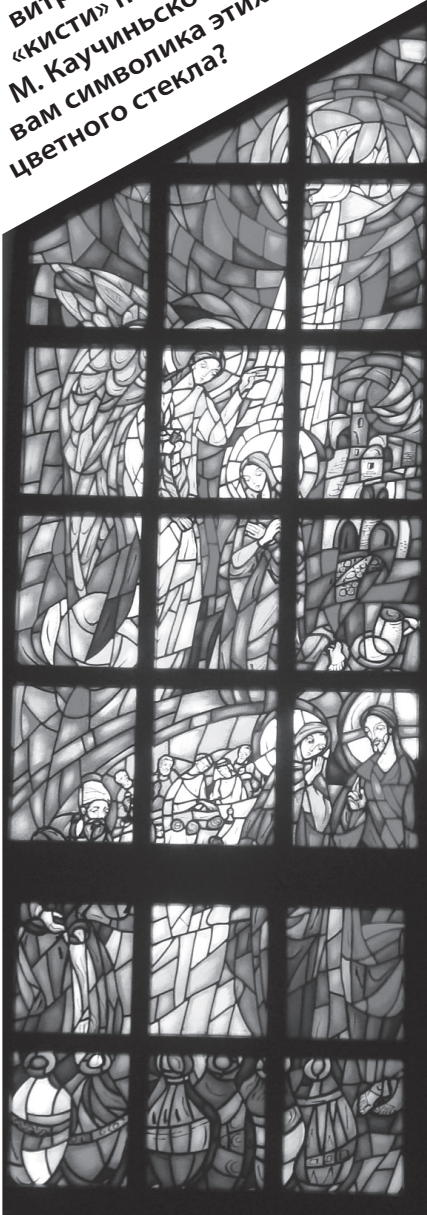
Благовещение. Храм в Атырау.

Большое значение во внутреннем убранстве храма в Атырау играют витражи, принадлежащие «кисти» польского художника М. Каучиньского. А известна ли вам символика этих картин из цветного стекла?