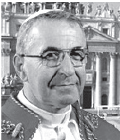
Папа Иоанн Павел I (1912–1978)