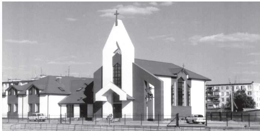
Кафедральный собор Преображения Господня в г. Атырау.

А на третьем витраже представлены три бабушки, которых мне довелось встретить в самом начале моей работы в Атырау. Память о тех, кто сохранил веру вопреки всем стараниям искоренить ее, всегда были и остаются источником надежды на то, что у Церкви есть все основания, чтобы жить и свидетелемствовать на этих землях.